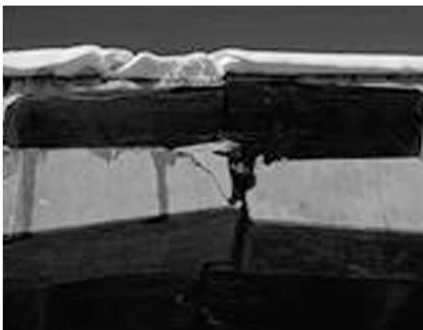
Image 38: Epuisement de cisaillement dans le cas d'une articulation plastique

Un épuisement de poutres en flexion peut avoir lieu dans le cas d'articulations plastiques suite à une armature de cisaillement insuffisante, comme représenté dans la figure. Un confinement FRP à haut module C-Sheet S&P 640 est utilisé comme renforcement.